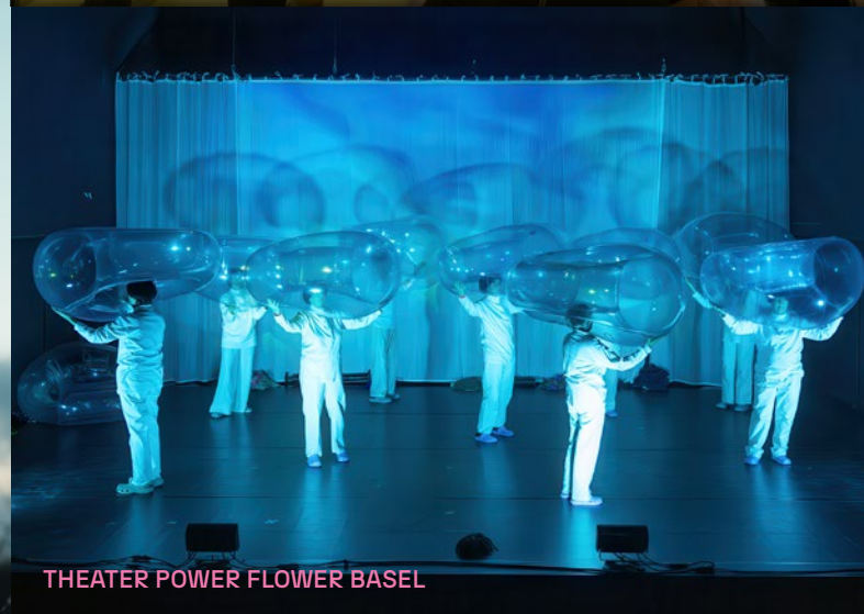
THEATER POWER FLOWER BASEL