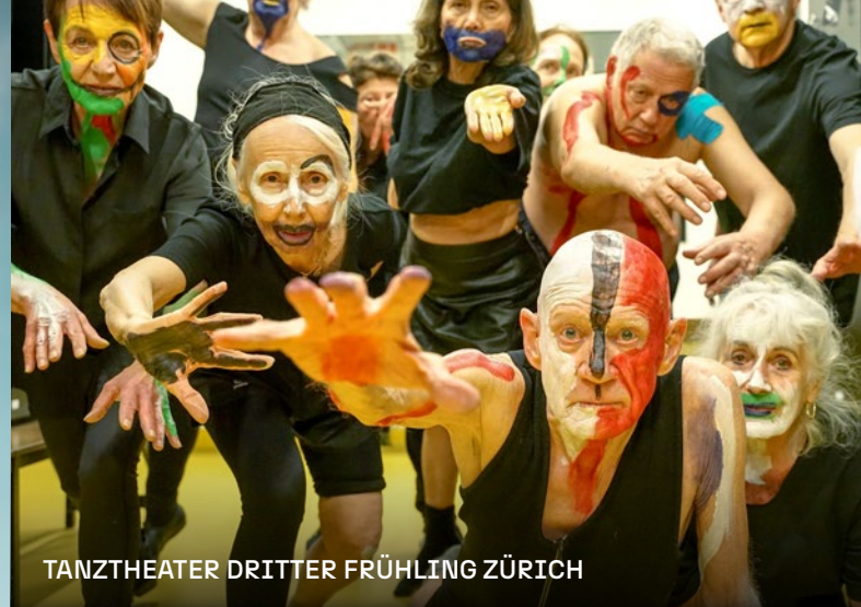
TANZTHEATER DRITTER FRÜHLING ZÜRICH