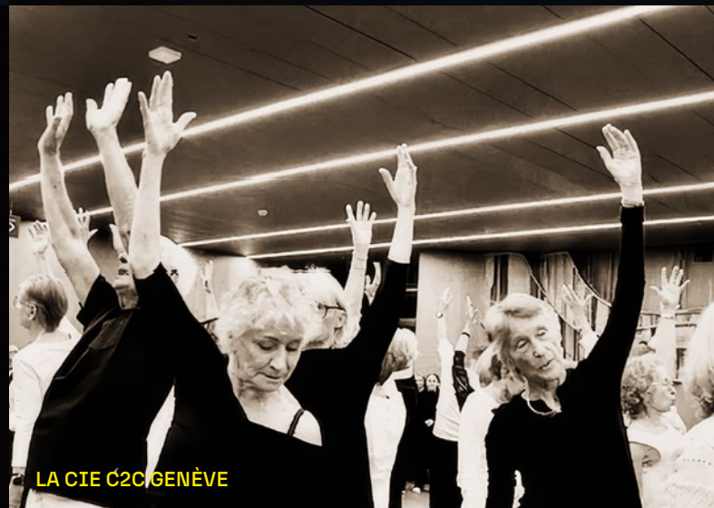
LA CIE C2C/GENÈVE