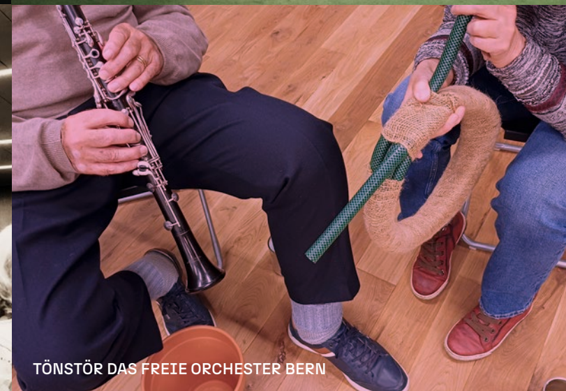
TÖNSTÖR DAS FREIE ORCHESTER BERN