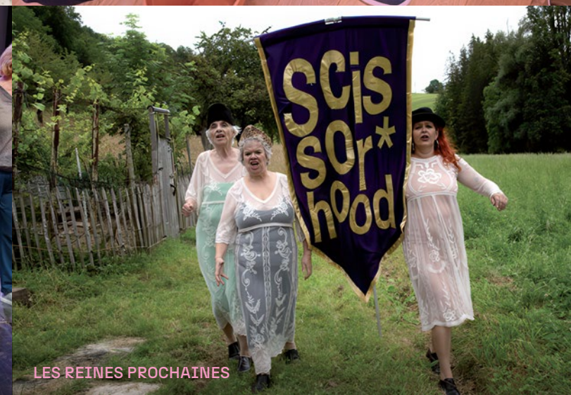
LES REINES PROCHAINES