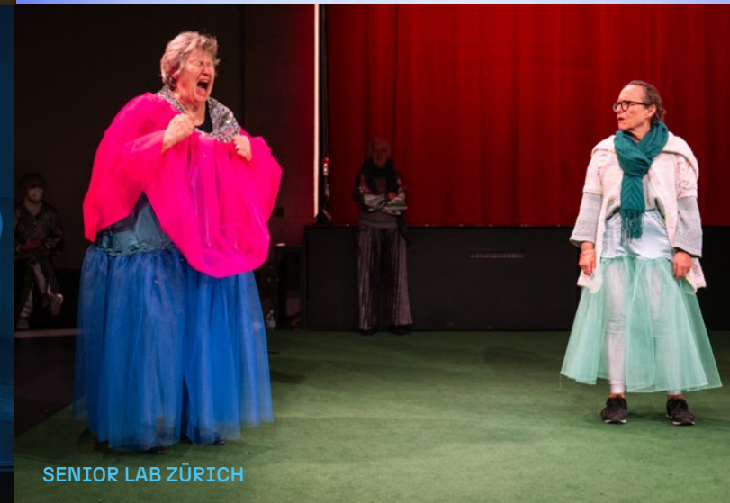
SENIOR LAB ZÜRICH